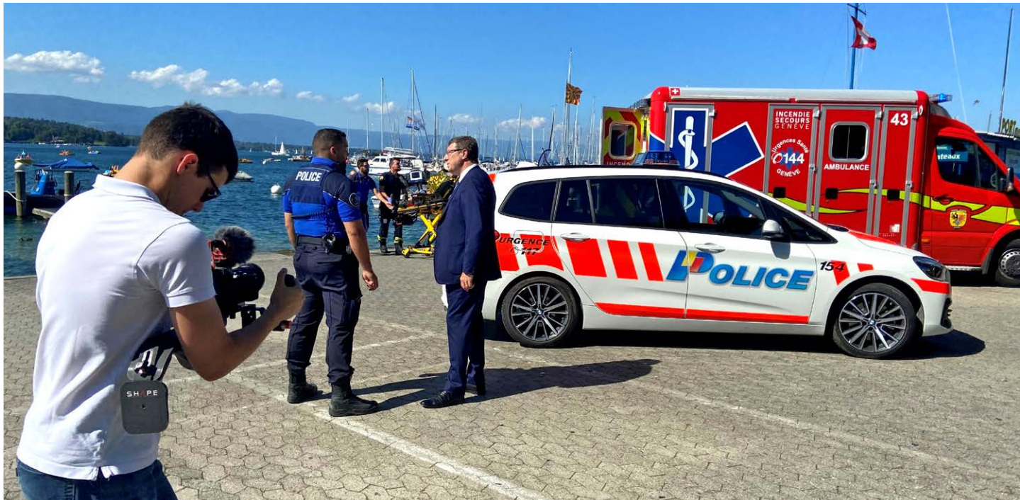
Lors du tournage vidéo avec le Conseiller d'État de Genève Mauro Poggia.

La FSFP a réussi à gagner des personnalités connues comme ambassadeurs ou ambassadrices de la campagne. Par exemple: