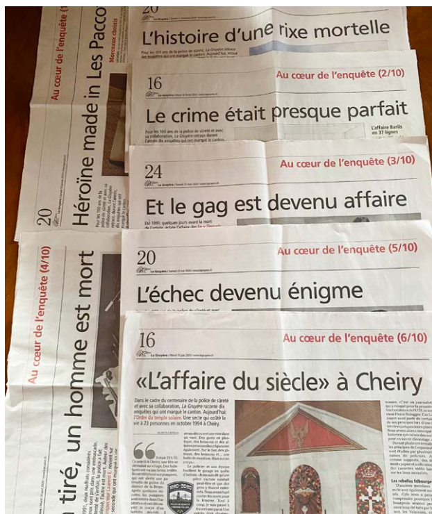
Rétrospective dans la presse fribourgeoise.

Le 1er janvier 2003, entrée en fonction de la Brigade meûrs et maltraitance ainsi que de la Brigade d'aide au commandement.