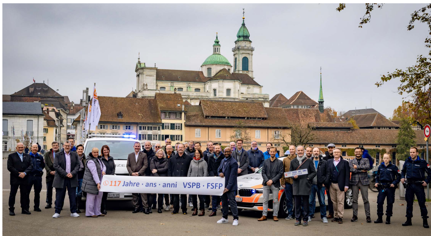
Photo du 117e avec en arrière-plan la cathédrale St-Ours.

Après le changement de présidence de la FSFP, la Fédération s'est concentrée sur l'intensification de sa présence au Palais fédéral.